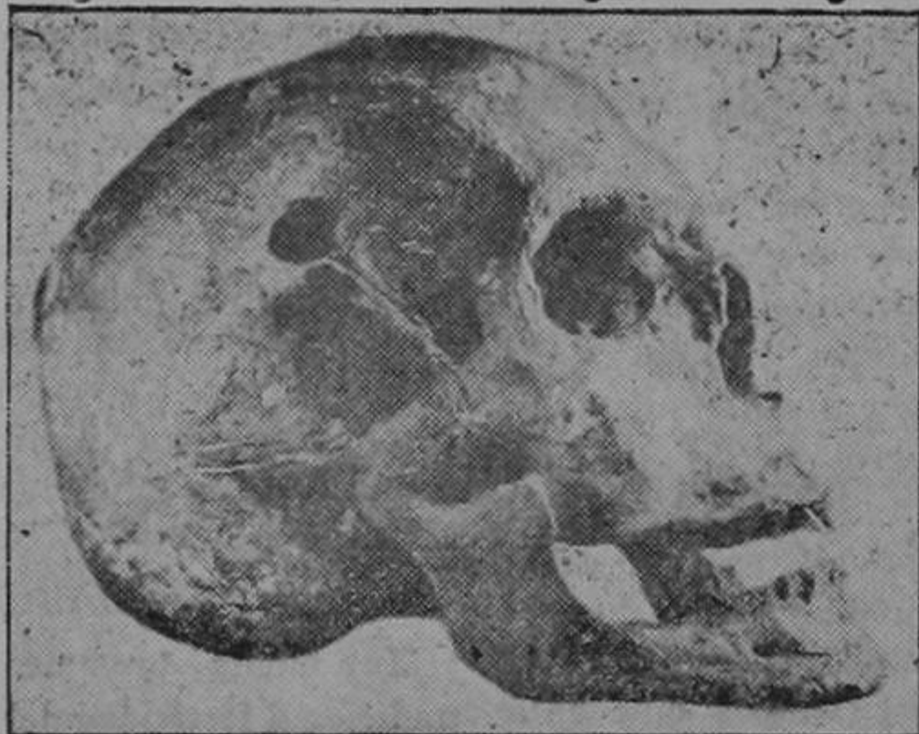
Calavera del Mariscal Sucre

tar su crimen y esperaron a la víctima. En la mañana del día cuatro de junio, Sucre continuó su viaje; eran las ocho de la mañana: los viajeros comenzaron a entrar en el sendero estrecho y difícil; caminaban despacio, uno en pos de otro: los asesinos, puestos en acecho, los estaban mirando, callados, por entre el tupido ramaje del bosque, y acomodaban, diligentemente, sus fusiles para dar en el blanco, que era el pecho del Mariscal de Ayacucho; cuando Sucre lle-